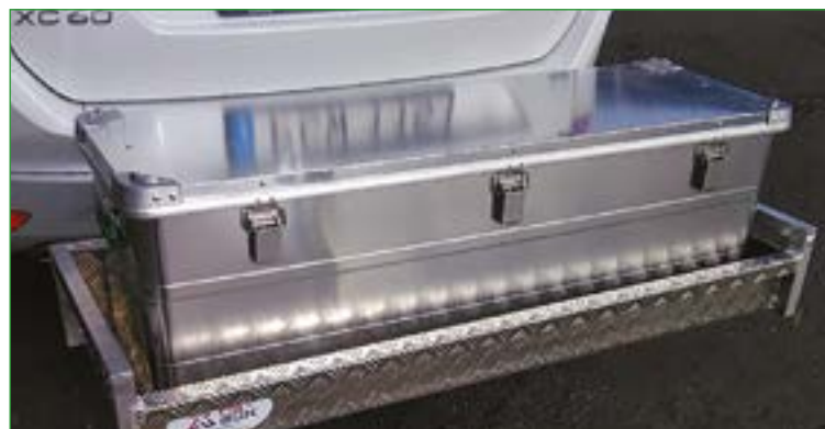
AL-905040 og AL-1204040 passer i HS-X Pack

Heck-Pack vinsjer er en god løsning for den som av og til trenger en vinsj på bilen, ATV'en eller i båthuset. Kan monteres på 50 mm tilhengerkule.